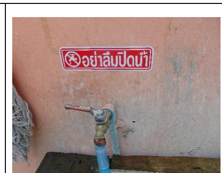
การรณรงค์ประหยัดน้ำ