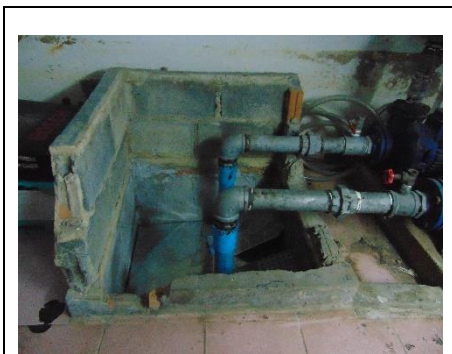
ถังน้ำสำรอง