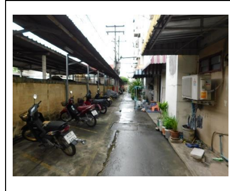
รั้วรอบโครงการ