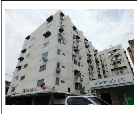
โครงสร้างอาคาร